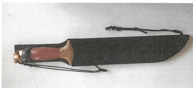
Modelo Onça Dourada