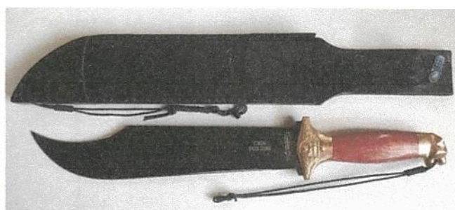
Modelo Onça Dourada